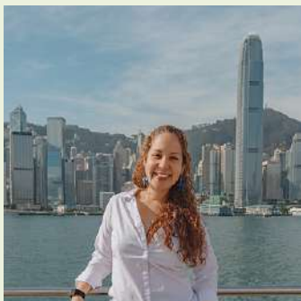
Sarai Operaciones, Guía 🇨🇴🇬🇧🇮🇹🇨🇦 Licencia en proceso