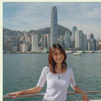
Pui Finanzas, Guía 🇨🇴🇨🇦 Licencia TG00013293